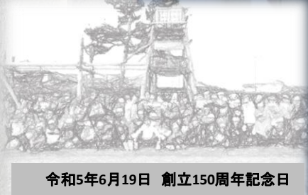
令和5年6月19日 創立150周年記念日

龍門館教育【龍門四つの教え】 (1) 切磋琢磨しようとする心 (学び) (2) 守礼の郷づくり (礼儀) (3) 美しい郷づくり (美化) (4) 家庭での読書の推進 (読書)